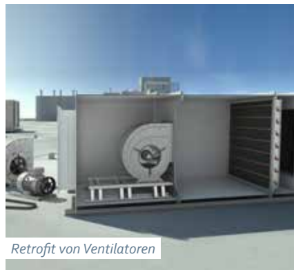
Retrofit von Ventilatoren