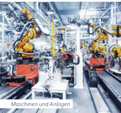
Maschinen und Anlagen